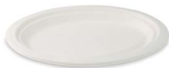
26 x 20 cm

Tanier okrúhly na 3 porcie BIO cukrová trstina 41028 bal. = 50 ks, kart. = 5 bal.