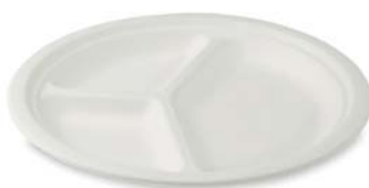
Ø 26 cm

Tanier okrúhly BIO cukrová trstina 41026 bal. = 50 ks, kart. = 5 bal.