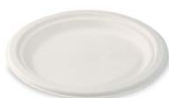
Ø 17,5 cm

Tovar je vyrobený z prebytku (odpadu) cukrovej trstiny, ide o druhotný materiál, ktorý bol bežne spaľovaný (tzv. „Bagasa“). Zo zvyšku jednej stonky cukrovej trstiny môže byť vyrobených až 50 jednorázových tanierov.