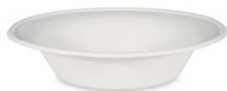
Ø 21 x 5 cm 700 ml

Miska okrúhla BIO cukrová trstina 42270 bal. = 50 ks, kart. = 3 bal.