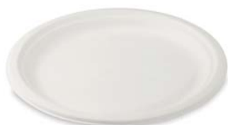
Ø 26 cm

Tanier okrúhly BIO cukrová trstina 41026 bal. = 50 ks, kart. = 5 bal.