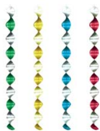
Rotorspirale (ALU) Ø 7,5 x 60 cm 66818 200 x 4 St. (10 x 20 Pck.)