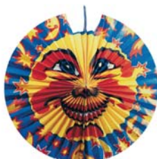
Lampion kokardenförmig SONNE+STERNE (PAP) Ø 45 cm 66868 120 x 1 St. (6 x 20 Pck.)