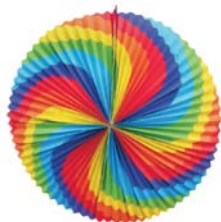
Lampion rund REGENBOGEN (PAP) Ø 34 cm 66864 120 x 1 St. (6 x 20 Pck.)