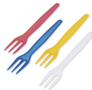
Pommes-Frites-Gabel bunt gemischt (PS) 8,5 cm 73021 10 x 1000 St. Auf Lager bis ca. 05/2021