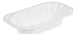
Imbißschale weiß 300 ml (PP) 17,2 x 9,8 x 3,9 cm 73615 8 x 250 St. Ausverkauft

i Diese Artikel sind aufgrund der Beschränkung von Einwegkunststoffen gemäß der Richtlinie (EU) 2019/904 des Europäischen Parlaments vom 5. Juni 2019 und des Herstellungsverbotes ab dem 03.07.21 ausgelistet.