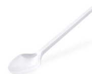
Kaffeelöffel weiß -BIO- (CPLA) 12,5 cm 40003 20 x 100 St.