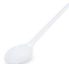
Löffel weiß (PS) 16,5 cm 65006 40 x 12 St.