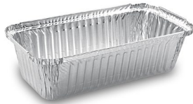
Schale eckig 900 ml (ALU) 21,8 x 11,4 x 5,4 cm 79194 5 x 100 St. Auf Lager bis ca. 05/2021