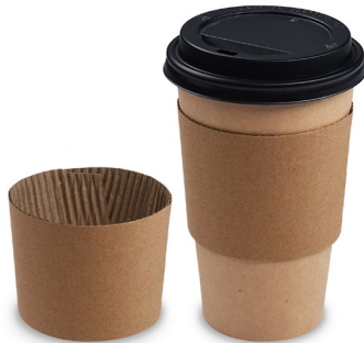
Papier-Manschette, braun für Becher Ø 90 mm (PAP) 76490 10 x 100 St.