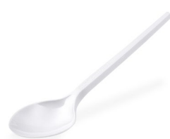
Löffel weiß -BIO- (CPLA) 17 cm 40006 20 x 100 St.