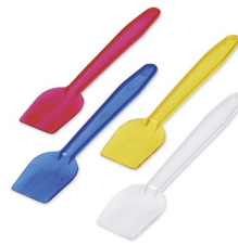
Eislöffel bunt gemischt (PS) 9,5 cm 73022 10 x 1000 St. Auf Lager bis ca. 05/2021