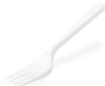
Salatgabel weiß (PP) 12 cm 73005 30 x 80 St. Auf Lager bis ca. 06/2021