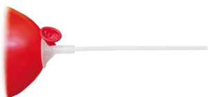
Ballonstab aus Kunststoff (PS) 40 cm 59910 25 x 10 St. Ausverkauft