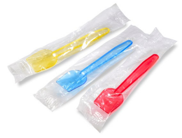
Eislöffel bunt gemischt einzeln gehüllt (PS) 9,5 cm 65010 10 x 100 St. Auf Lager bis ca. 05/2021