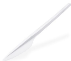
Messer weiß -BIO- (CPLA) 17 cm 40008 20 x 100 St.