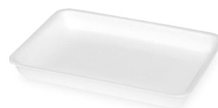
Schale S4 weiß (XPS) 290 x 208 x 32 mm 99402 1 x 900 St.