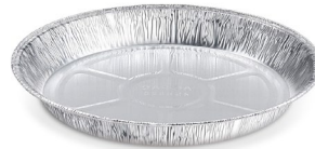
Teller rund 620 ml (ALU) Ø 21,4 x 2,3 cm 79222 1 x 200 St.