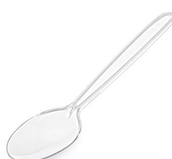
Löffel PREMIUM klar (PS) 18,5 cm 73076 40 x 50 St.