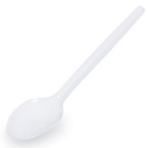
Mokkalöffel weiß (PS) 10,5 cm 73002 40 x 100 St. Auf Lager bis ca. 05/2021