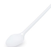
Kaffeelöffel weiß (PS) 12,5 cm 65003 40 x 20 St.