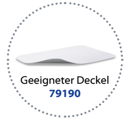
Geeigneter Deckel 79190