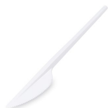
Messer weiß (PS) 16,5 cm 65008 40 x 12 St.