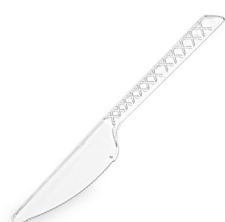
Messer stabil klar (PS) 17,5 cm 73058 20 x 100 St.