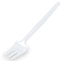
Kuchengabel weiß (PS) 14 cm 73004 20 x 100 St. Auf Lager bis ca. 06/2021