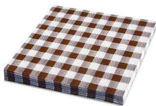
Serviette KARO braun (PAP - 100% Zellstoff) 33 x 33 cm 82502 12 x 20 St.