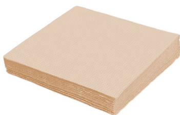
Serviette natur (PAP - 100% Zellstoff) 33 x 33 cm 70521 28 x 100 St.