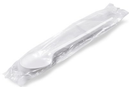
Kaffeelöffel weiß einzeln gehüllt (PS) 12,5 cm 65013 10 x 100 St. Auf Lager bis ca. 05/2021