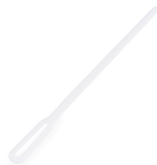
Kaffee-Rührstäbchen weiß (PS) 11 cm 73011 5 x 1000 St. Auf Lager bis ca. 05/2021