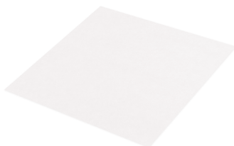
Papierzuschnitt, fettdicht (PAP) 30 x 30 cm 90030 1 x 1000 St.