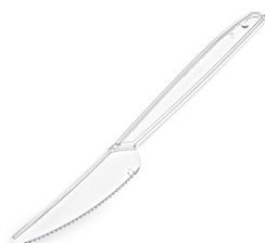
Messer PREMIUM klar (PS) 18,5 cm 73078 40 x 50 St.