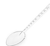
Kaffeelöffel stabil klar (PS) 12,5 cm 73053 20 x 100 St.