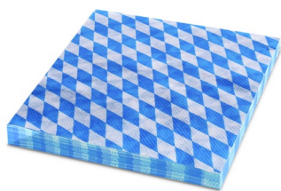
Serviette BAYERN blau (PAP - 100% Zellstoff) 33 x 33 cm 82512 12 x 20 St.