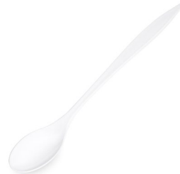
Cocktail-Löffel weiß (PS) 21 cm 73030 16 x 100 St. Auf Lager bis ca. 05/2021