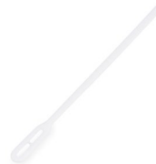
Kaffee-Rührstäbchen weiß (PS) 13 cm 73013 7 x 1000 St. Auf Lager bis ca. 05/2021