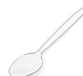
Kaffeelöffel PREMIUM klar (PS) 13 cm 73073 40 x 50 St.