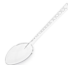
Löffel stabil klar (PS) 17,5 cm 73056 20 x 100 St.