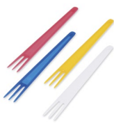
Pommes-Frites-Gabel bunt gemischt (PS) 7,5 cm 73020 10 x 2000 St. Auf Lager bis ca. 05/2021