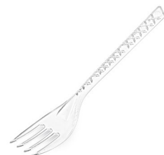
Gabel stabil klar (PS) 17,5 cm 73057 20 x 100 St.