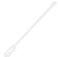
Kaffee-Rührstäbchen weiß (PS) 16 cm 73016 5 x 1000 St. Auf Lager bis ca. 04/2021