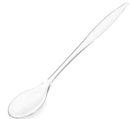
Cocktail-Löffel klar (PS) 21 cm 73031 16 x 100 St. Auf Lager bis ca. 05/2021