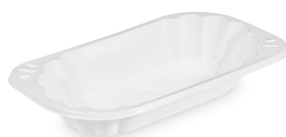
Imbißschale weiß 250 ml (PP) 17,2 x 9,8 x 3,1 cm 73614 8 x 250 St. Ausverkauft