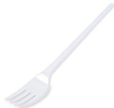
Gabel weiß (PS) 16,5 cm 65007 40 x 12 St.