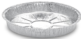
Teller rund 600 ml (ALU) Ø 19,5 x 2,5 cm 79219 10 x 100 St. Ausverkauft