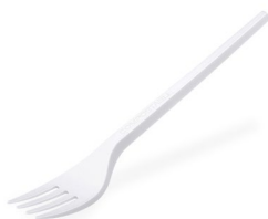
Gabel weiß -BIO- (CPLA) 17 cm 40007 20 x 100 St.