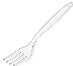
Gabel PREMIUM klar (PS) 18,5 cm 73077 40 x 50 St.