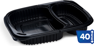
Mikrowellenschale, 2-geteilt 78312 100 Stück