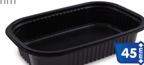
Mikrowellenschale 850 ml 78185 50 Stück