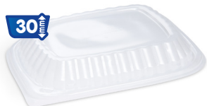
Domdeckel für 78311 78301 100 Stück

Weniger Kunststoff bei gleichbleibenden Materialvorteilen von PP.