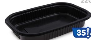
Mikrowellenschale 750 ml 78175 50 Stück