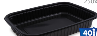
Mikrowellenschale 1200 ml 78212 50 Stück