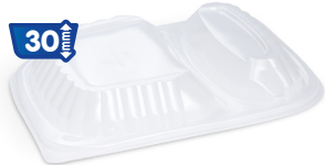
Domdeckel für 78312 78302 100 Stück