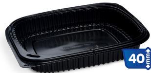
Mikrowellenschale 78311 100 Stück