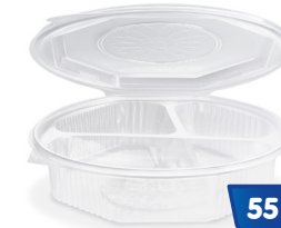
Menüschale achteckig klar mit Deckel, 3-geteilt, 930 ml PP817 25 Stück