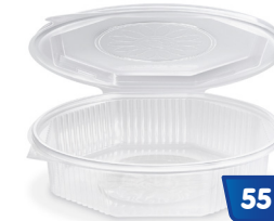
Menüschale achteck klar mit Deckel, 1200 ml PP814 25 Stück

Der anhängende Deckel dieser Menüschalen garantiert schnelles und sicheres Verschließen, schießt diese wasserdicht ab und kann an der Perforation leicht abgetrennt werden. Die Form von Deckel und Boden machen das Stapeln einfach.