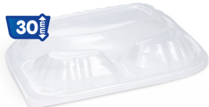
Domdeckel für 78313 78303 100 Stück