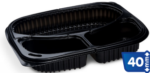
Mikrowellenschale, 3-geteilt 78313 100 Stück