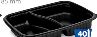
Mikrowellenschale 2-geteilt 1100 ml 78222 50 Stück