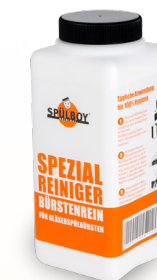
Bürstenreiniger Classic für ca. 33 Anwendungen [1 kg] S2910 10 x 1 St.

Alle angebotenen Chemikalien sind zertifiziert.