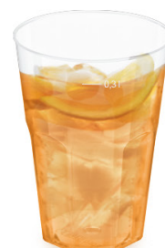
Pfandbecher Cocktail Ø 8 cm / 0,3 l (PP) 20130 15 x 30 St. Ø 8,1 cm / extra stabil 21130 15 x 15 St.