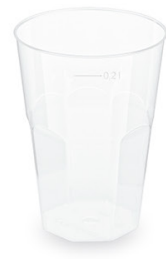
Pfandbecher Cocktail Ø 7 cm / 0,2 l (PP) 20120 20 x 25 St. extra stabil 21120 20 x 12 St.