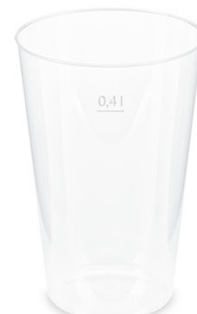
Pfandbecher Ø 8,6 cm / 0,4 l (PP) 20040 10 x 50 St. Ø 8,7 cm / extra stabil 21040 12 x 10 St.