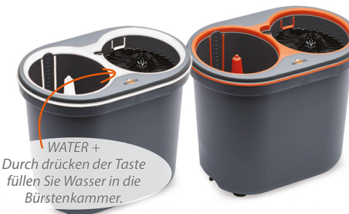
Spülboy NU water+ portable (w. 27) x (h. 34) x (l. 39,5) cm S0144 6 x 1 St.

Das Standard SPÜLBOY® Zubehör ist zum Spülen unserer Mehrwegbecher von Ø 5,5 cm bis Ø 8 cm geeignet. Für größere Durchmesser empfehlen wir den Kauf eines Satzes XL-Bürsten aus unserem Zubehör.