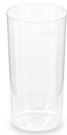
Pfandbecher Longdrink Ø 5,6 cm / 2 cl / 0,2 l (PP) 20102 50 x 10 St.