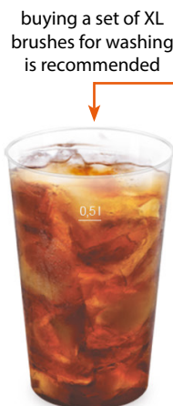
Pfandbecher Ø 9,1 cm / 0,5 l (PP) 20050 12 x 30 St. Ø 9,3 cm / extra stabil 21050 12 x 12 St.