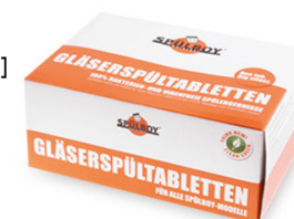
Gläserspültabletten Classic 48 x 4 St. [750 g] S2938 10 x 1 St.

SPÜLBOY® Tabletten wirken wie Seifen auf Basis von „Tensiden“. Dies macht sie sehr effektiv bei der Vernichtung von Bakterien und Viren. Nachweislich werden bis zu 99,9% der Bakterien, Herpes, Escherichia coli, Pseudomonas und HSV Typ 1-Viren bei jeder Kaltwasserspülung vernichtet.