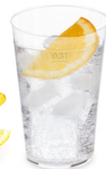
Pfandbecher Ø 7,9 cm / 0,3 l (PP) 20030 25 x 20 St. Ø 8 cm / extra stabil 21030 15 x 15 St.