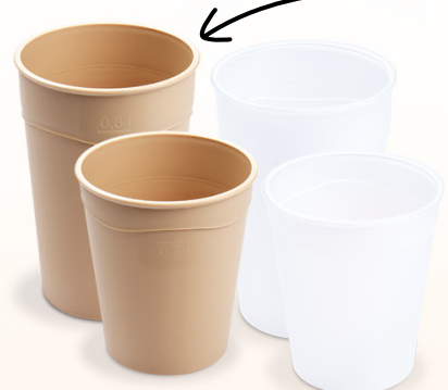
Mehrwegbecher creme Ø 8 cm / 0,3 l (PP) 21330 15 x 10 St. Ø 8 cm / 0,2 l (PP) 21320 15 x 10 St.