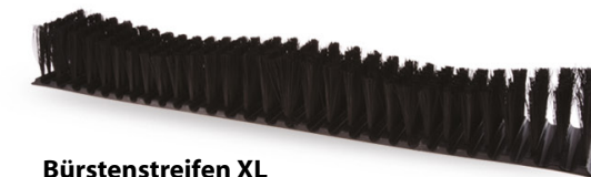
Bürstenstreifen XL S0352 16 x 1 St.

Das XL-Set ist ideal für Becher mit größerem Durchmesser.