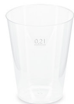
Pfandbecher Ø 6,8 cm / 0,2 l (PP) 20020 20 x 40 St. Ø 7,6 cm / extra stabil 21020 15 x 25 St.