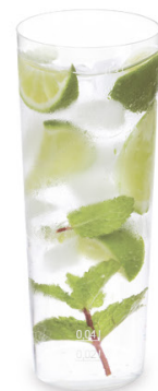
Pfandbecher Longdrink Ø 5,9 cm / 2 cl / 0,3 l (PP) 20103 50 x 10 St.