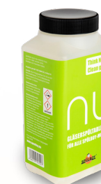
Gläserspültabletten Spülboy NU 100 St. [500 g] S0410 12 x 1 St.