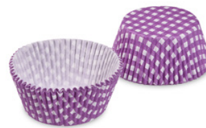
Gebäckkapsel - Karo, violett (PAP) Ø 50 x 30 mm 65586 50 x 40 St. Auf Lager bis ca. 04/2022