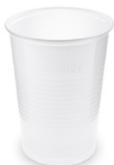
Trinkbecher weiß (PP) Ø 95 mm 0,4 L 73204 32 x 50 St. Ausverkauft