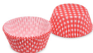
Gebäckkapsel - Karo, rot (PAP) Ø 50 x 30 mm 65581 50 x 40 St. Ausverkauft