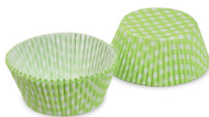
Gebäckkapsel - Karo, grün (PAP) Ø 50 x 30 mm 65583 50 x 40 St. Auf Lager bis ca. 05/2022