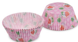
Gebäckkapsel - Glück (PAP) Ø 50 x 30 mm 65592 50 x 40 St. Auf Lager bis ca. 04/2022