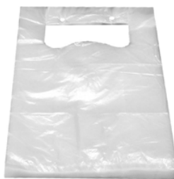
Knotenbeutel, geblockt, transparent (HDPE) 22+11 x 38 cm 68513 25 x 100 St. Auf Lager bis ca. 03/2022