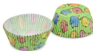
Gebäckkapsel - Küken (PAP) Ø 50 x 30 mm 65594 50 x 40 St. Auf Lager bis ca. 04/2022