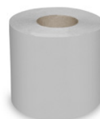
Toilettenpapier Harmony Professional (PAP - Recycling) Ø 9,3 cm, 50 m (12.5 cm x 400) H4101 1 x 30 St. Auf Lager bis ca. 05/2022