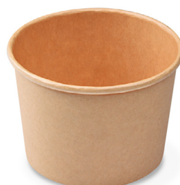
Papierbecher / Eisbecher, kraft (PAP/PE) Ø 75 mm 125 ml 79813 20 x 50 St. (PAP/PE) Ø 90 mm 250 ml 79926 16 x 50 St.