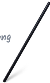
Trinkhalm, schwarz (Bio-Komposit) Ø 6 mm x 21 cm 40219 20 x 200 St.