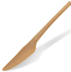
Messer, natur braun (Bio-Komposit) 17 cm 40008 20 x 50 St.