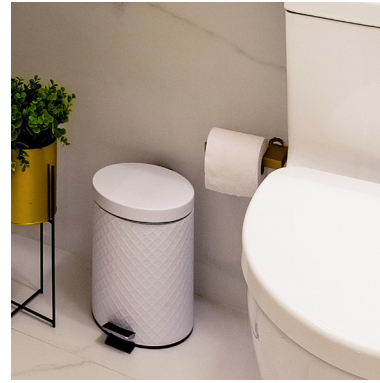
Toilettenpapier, weiß, 250 Blatt (PAP - FSC Mix) Ø 10,5 cm, 28 m (250 x 11,2 cm) 60302 8 x 8 St.