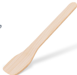
Eislöffel (Bambus) 66504 50 x 100 St.