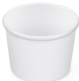
Papierbecher / Eisbecher, weiß (PAP/PE) Ø 75 mm 125 ml 79812 20 x 50 St. (PAP/PE) Ø 90 mm 250 ml 79925 16 x 50 St.