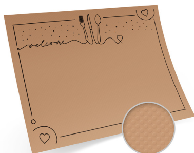
Tischset - "welcome", kraft (PAP) 40 x 30 cm 70125 5 x 200 St.