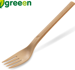
Gabel, natur braun (Bio-Komposit) 17 cm 40007 20 x 50 St.