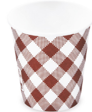
Pappbecher - Karo (PAP/PE) Ø 73 mm 200 ml `S: 0,18 L / 7 oz` 76720 20 x 50 St. Auf Lager bis ca. 07/2024 (PAP/PE) Ø 80 mm 280 ml `M: 0,2 L / 8 oz` 76728 20 x 50 St. Auf Lager bis ca. 07/2024 (PAP/PE) Ø 90 mm 420 ml `L: 0,3 L / 12 oz` 76742 16 x 50 St. Ausverkauft