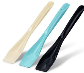
Eislöffel, bunt gemischt (Bio-Komposit) 9,5 cm 40004 20 x 100 St. Lieferbar ab 01.07.2024

Hergestellt aus innovativen Naturmaterialien ohne Mikroplastik.