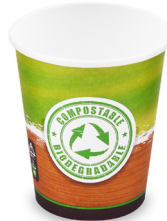
Pappbecher (PAP/PLA) Ø 80 mm 280 ml `M: 0,2 L / 8 oz` 76528 20 x 50 St. Auf Lager bis ca. 07/2024