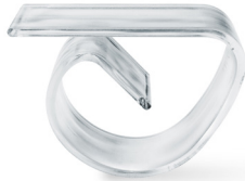
Tischtuchhalter, transparent (PS) 70099 50 x 4 St. Ausverkauft